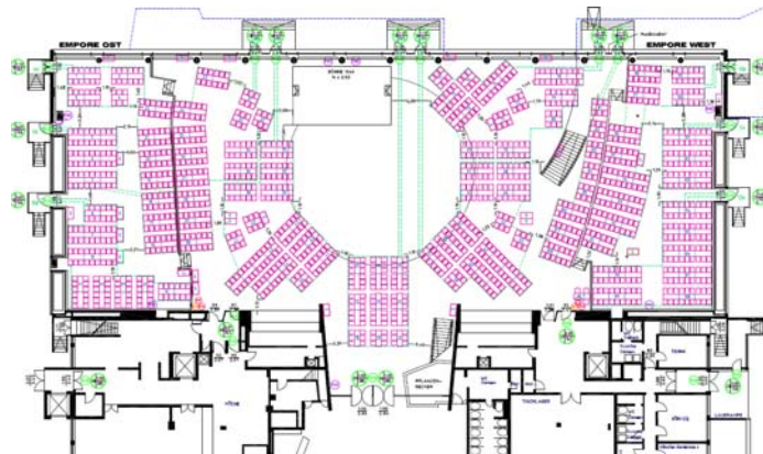
Grundriss EG Plan 09 – Floor plan ground floor # 09

*) Personalkosten für Auf- und Abbau und Betrieb während der Veranstaltung der Einrichtungen siehe Punkt 2 der Preisliste.